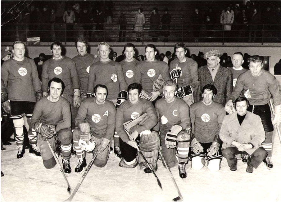
Eishockeyteam TEAM 70