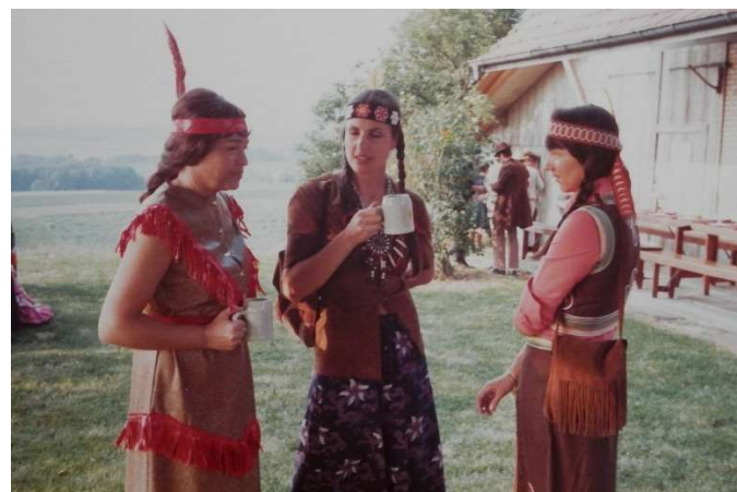
TEAM 70, GV interner Event: Unsere Squaws

Die Equipe Bernoise ist somit heute der einzige Club der aktiven Fahrer und verfügt über einen aktiven Vorstand und eine gesunde Kasse.