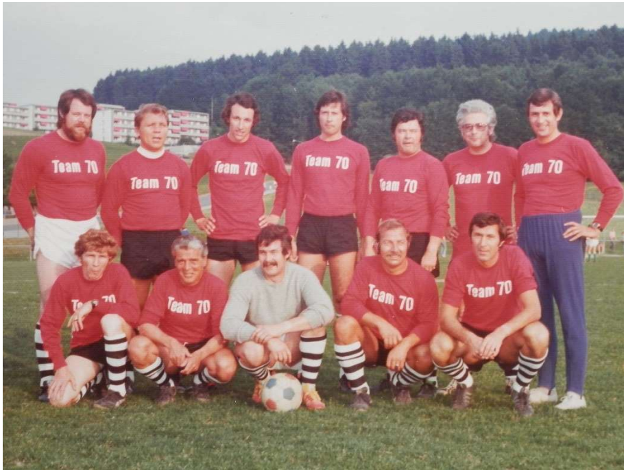
Fussballteam TEAM 70