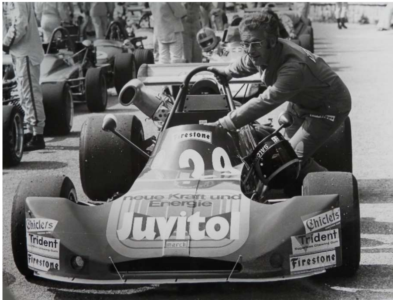
Mit dem neuen March 732 BMW F2 am Vorstart