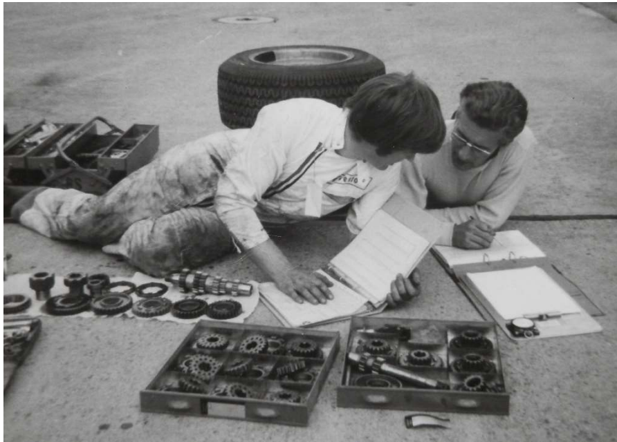
Grosse Frage, welche Übersetzungen bauen wir ein?