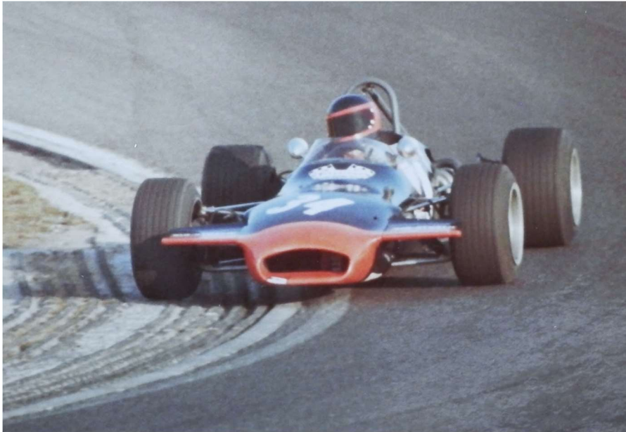
Mit dem Brabham BT 28 Vegatune im «Dattelsack» von Hockenheim

«Où il y a le risque, il y a la mort, ou il n'y a pas de risque, il n'y a pas de vie.»