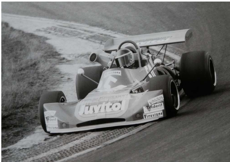
Mit dem March 732 F2 im «Dattelsack» von Hockenheim

bei einem BMW-Unterhaltsbetrieb in Hamburg verkürzt, während wir das Campingleben genossen und schwedische Lebensweisen kennen lernten.